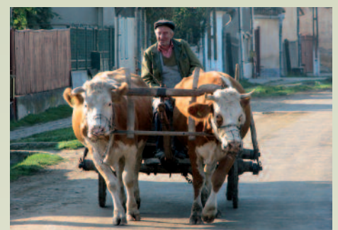
Begegnung mit archaischen Verkehrsmitteln.